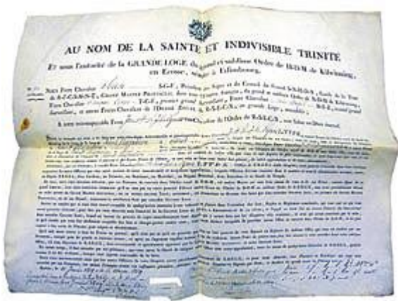
Le diplôme signé par Cambacérès.